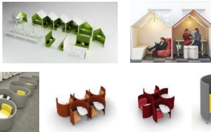
صورة(22) نماذج الأثاث الإدارى التطوري.

أولاً: نماذج الأثاث الإدارى التطوري كما توضح صورة(22) يمكن تصميم غرف عمل تطويرية على شكل أكواخ تستخدم لعدة أغراض كمناطق (للعمل والاسترخاء والاجتماعات، مصممة من خامات خفيفة من الأخشاب والنسيج المعالج العازل للصوت. أيضا الوحدات مصممة على شكل وحدات هندسية يمكن تكرارها في عدة اتجاهات لتتطور الى عدد أكبر من المكاتب ووحدات الجلوس. 26