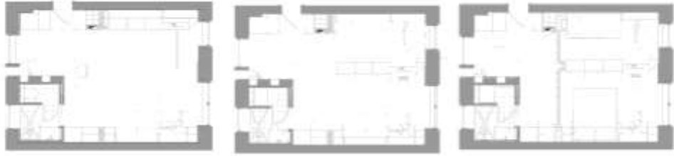
شكل (6) المسقط الأفقى لغرفة النوم المتطورة يوضح تطور الأثاث المدمج في الحوائط الثابتة

الأثاث المثبتة في الحائط متعددة الاستخدامات. مثال غرفة النوم المتطورة من تصميم Adrian Iancu شكل (6) يوضح المسقط الأفقى للغرفة في حالة تطورها حيث تم تصميم جميع الأثاث مدمج في الحوائط الثابتة للاستخدام حسب الحاجة.