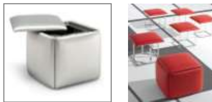
صورة(13) كبسولة المقعد المتحول

3-كبسولة المقعد المتحول وحدة مقعد جلوس صورة(13) مصمم بشكل مكعب يمكن تحويله الي خمسة مقاعد حيث يتطور في حالة زيادة عدد الأفراد. ويمكن تجميعه بتداخل أجزاءه ليصبح مكعب من جديد. 17