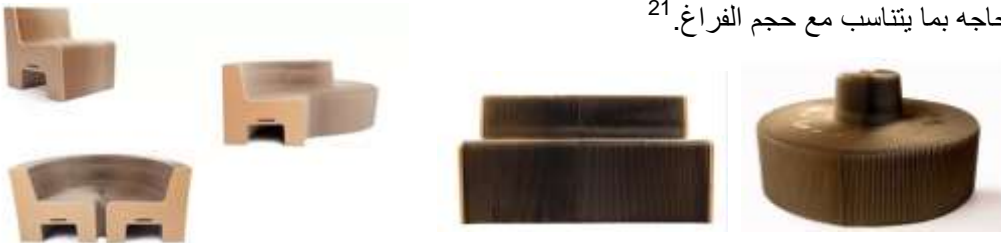
صورة (18) الكرسي المتطور لقابل للتمدد.

2- الكرسي المرن القابل للتمدد صورة (18) مصنع من الورق المقوى والنفائات الخشبية معاده التدوير. قطعة واحدة من الأثاث لها القدرة على التمدد لاستيعاب عدد أكبر من الأفراد، يمكن ببساطة سحب كل نهاية لخلق مقاعد قوية يتغير طولها وشكلها حسب الحاجة بما يتناسب مع حجم الفراغ. 21