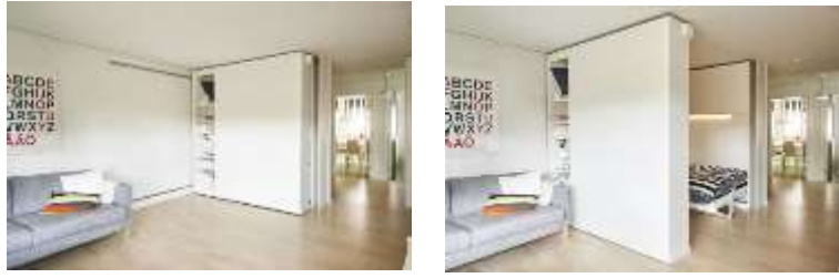
صورة (2) السرير المدمج في الحائط يتحرك على مجرى بحيث يمكن فتحه وغلقة تبعاً للحاجة مما يزيد من مساحة الفراغ.

كما توضح الأمثلة التالية صورة (2،3) أنه من خلال تصميم وحدات أثاث مدمج في الحائط المتحرك يمكن ضم أو توسيع أجزاء من الفراغ لإعادة استخدام المساحة الأصلية بأكثر من شكل تبعاً للحاجة. كما تمكن مساحات ثابتة للنمو من خلال الاستفادة من هذه الحوائط المتحركة لإعادة التقسيم الداخلي في حاله تغير الاستخدام.