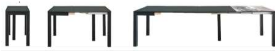
صورة (8) الأثاث التطوري يتميز بحرية حركة أجزائه المختلفة 9