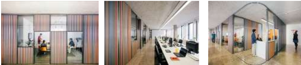
صورة (1) أشكال الفواصل المنزلقة وعلاقتها بفتحات الأبواب والنوافذ وميكانيزم حركتها

مساحة العمل مصممة بنظام مرن مقسم بمجموعة من الفواصل المتحركة والتي تسمح بتغيير مساحة المكاتب مع تغيير الاحتياجات. عندما تبدأ الشركة في النمو تحتاج لزيادة مساحة المكاتب المتوفرة لديها حيث أن التصميم يسمح بانزلاق الجدران شكل (1) لإعادة التقسيم الداخلي للمساحات بسهولة. نظام الفواصل المنزلقة كما توضح الصورة (1) مكون من فواصل معدنية مموجة مثبتة على إطار معدني ولديها القدرة على حرية التشكل، كذلك متصلة بمجرى في السقف والأرضية ليسمح بإنزلاقها بحرية عند الحاجة، ويثبت معها أيضا الأبواب والنوافذ، مما يسمح بفتح المساحات أو إغلاقها اعتمادا على ما هو مطلوب .