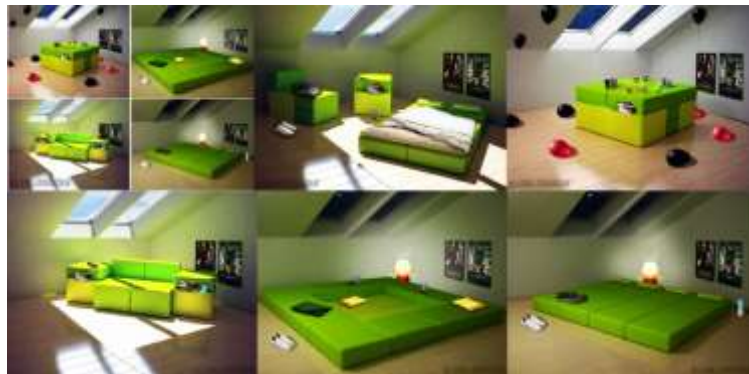
صورة(4) الأثاث المتحول يتغير شكله وحجمه ليصبح متعدد الاستخدامات كما يتطور في حاله زيادة عدد الأفراد.

يصلح الأثاث المتحول للاستخدام للأغراض المتعددة، كذلك للاستخدام في الحالة المفردة أو في حالة زيادة عدد الأفراد في الفراغ الواحد كما في صورة (4) يمكن أن تستخدم قطعة الأثاث المتحولة في عدة أشكال لعدة استخدامات مثل كبنه جلوس لشخصين يمكن تطويرها لتصبح جلسة عربية تكفي 8 أشخاص ، أو غرفة نوم لشخصين وفي حالة زيادة عدد الأفراد يمكنها أن تتطور لتكفي 4 أشخاص.