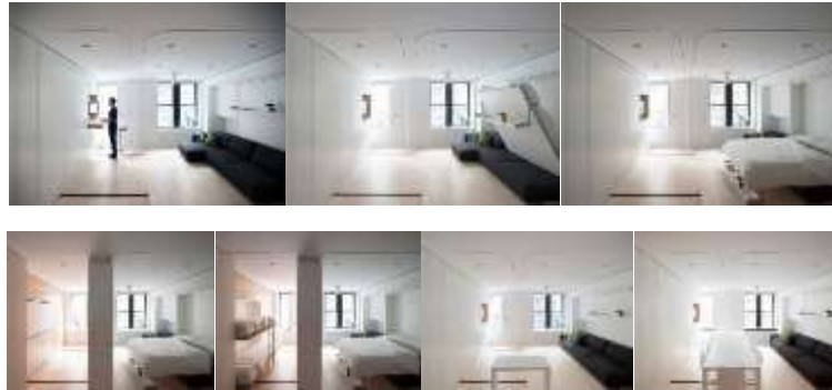
صورة (20) غرفة النوم المتطورة تضم مجموعة من الأثاث التطوري المدمج في الحوائط. 24

كما توضح صورة (20) في الحالة العادية تصلح الغرفة للنوم وأيضا للمعيشة في نفس الوقت أما في حالة زيادة عدد الأفراد المستخدمين تتطور قطع الأثاث المدمجة في الحائط الثابت لزيادة عدد الأسرة فتصبح غرفتي نوم ، كما تتطور وحدة المنضدة لاستيعاب عدد أكثر من الأفراد.