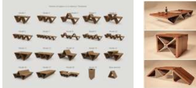
شكل(3) الأثاث التطوري من شكل هندسي منتظم يسهل تكراره على مديول. 12

الأثاث التطوري أثاث يخضع لشبكة منتظمة بشكل كبير وجميع الوحدات مصممة من أشكال هندسية لها أبعاد محددة ليسهل تكرارها على مديول كما في الشكل(3) مع الحفاظ على الشكل لأصلى لها، والتطور يتم بحسابات دقيقة حتى يتناسب مع تطور الفراغ نفسه. كذلك الأشكال الهندسية الغير منتظمة تتبع شبكة مديولية كما في الصورة(10).