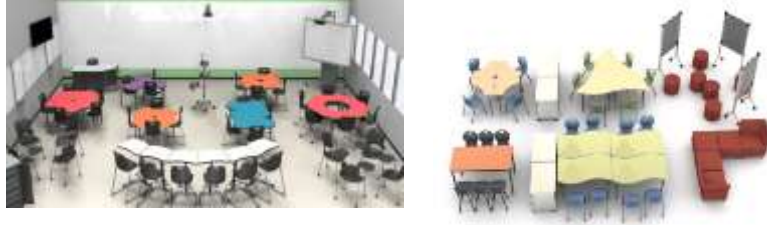
صورة (23) نماذج الأثاث المدرسي التطوري.

ثانياً: نماذج الأثاث المدرسي التطوري كما توضح صورة (23) تتنوع أشكال الأثاث المستخدم في المدارس والجامعات ويتميز بقابليته للتطور لاستيعاب الأعداد المختلفة من الطلاب ، يمكن تطور الوحدات المصممة من أشكال هندسية من خلال التكرار مع الازاحة في نفس الاتجاه أو في اتجاهات مختلفة والتي تتمتع بالمرونة حيث يمكن تغييرها داخل نفس المساحة. 27