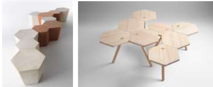
الصورتين (6،7) قطع أثاث تطورية تحاكي نمو خلية النحل.

كذلك محاكاة نمو خلايا النحل حيث أن الشكل السداسى يسمح بإنتاج شبكة كاملة من الوحدات، يمكنها أن تتطور من خلال تطبيقها على تصميم الجلسات أو المناضد كما في الصورتين (6،7).