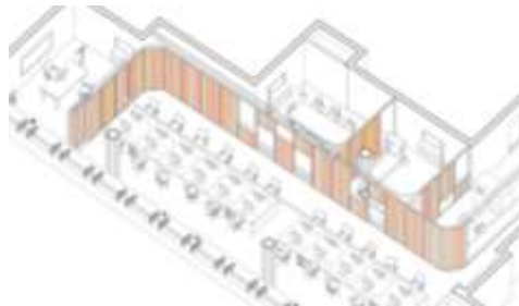
شكل (1) نظام الفواصل المنزلقة يسمح بزيادة المساحات الداخلية للفراغات وإعادة تقسيمها حسب الحاجة.

تطور التصميم الداخلي لأي فراغ يتطلب أن تكون عناصر هذا الفراغ مرنة وقابلة للنمو لذا لا يصلح تصميم الجدران الداخلية الثابتة التقليدية من الطوب بينما يمكن استبدالها بالفواصل المتحركة والتي من خلالها يمكن التحكم في مساحة الفراغ وزيادتها عند الحاجة.