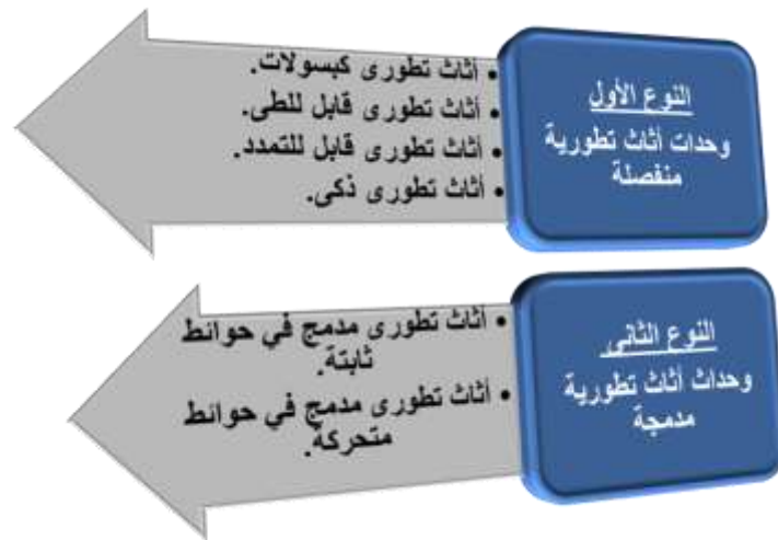
شكل(4) أنواع الأثاث التطوري. 13

تغير مفهوم تصميم الأثاث من الإستاتيكية إلى الديناميكية وأصبحت المرنة هي المبدأ الأساسي في تصميم الأثاث التطوري. وعلى أساس ذلك يمكن تصنيف أنواع الأثاث التطوري إلى نوعين كما يوضح شكل(4) التالي: