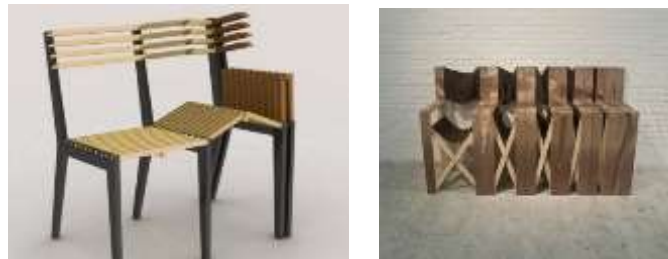
الصورتين (14،15) وحدات الكراسي المتطورة القابلة للطي.

1- مجموعة من الكراسي قابلة للطي عندما لا يكون هناك حاجة لاستخدامها مما يوفر المساحة كذلك يمكن تخزينها بسهولة أو نقلها، بسبب خفة الوزن النسبية. 18