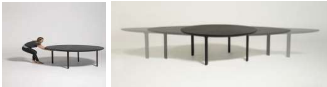
صورة (17) المنضدة المتطورة القابلة للتمدد. 20

1- المنضدة القابلة للتمدد صورة (17) ، هيكل المنضدة قابل للتمدد حيث أنه مصنع من شبكة من الشرائح عبارة عن صفائح ورق معالجة بمادة راتنجية ، يمكن التحكم في مساحتها حيث تتطور بالشد للخارج لتعطي أضعاف مساحتها الأصلية لاستيعاب عدد أكبر من الأفراد. يمتد الشكل من سطح دائري يمكن أن يتسع لثمانية أشخاص، إلى هيكل بيضاوي الشكل طوله أربعة أمتار يمكن أن يستوعب اجتماعات فريق كبير.