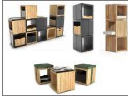
صورة (12) كبسولة التخزين المكعبات

3-كبسولة المقعد المتحول وحدة مقعد جلوس صورة(13) مصمم بشكل مكعب يمكن تحويله الي خمسة مقاعد حيث يتطور في حالة زيادة عدد الأفراد. ويمكن تجميعه بتداخل أجزاءه ليصبح مكعب من جديد. 17