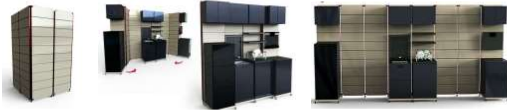
صورة (16) وحدة مطبخ المتطورة القابلة للطي. 19