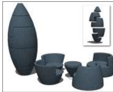
صورة(11) كبسولة المسلة

1-كبسولة المسلة وحدة أثاث مصنوعة من عدة أجزاء من الألومنيوم ونسيج البولي إيثيلين، تحتوي هذه الوحدة المكونة من خمسة قطع على أربعة كراسي ومنضدة صورة(11) يمكن أن تستخدم مفردة حسب عدد الأفراد ويمكن تجميعها على شكل مسلة في حالة عدم الاستخدام لتوفير المساحة. 15