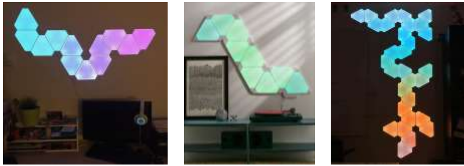
صورة (19) لوحات الإضاءة الذكية التطورية بتغير لونها حسب الاستخدام للفراغ الواحد.