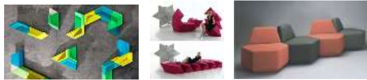
صورة(10) مجموعة صور لقطع أثاث تطويرية من أشكال هندسية غير منتظمة تتبع شبكة مديولية.