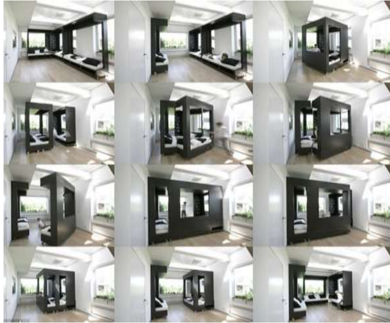
صورة(21) غرفة الجلوس المكعبة والأثاث التطوري المدمج في حائطها المتحرك. 25