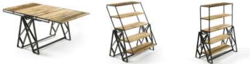
شكل (2) الأثاث التطوري التكراري حيث تنمو الوحدات في الاتجاهين الأفقي والرأسي 10

يعتمد الأثاث التطوري على مبدأ التكرار حيث يمكن استخدام شكل هندسي مثل المستطيل وتكراره في اتجاهات مختلفة مع تغيير أبعاده في كل من الاتجاهين الأفقي والرأسي كما يوضح شكل (2).